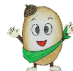
上尾かしの木特別支援学校 マスコットキャラクター「かっしー」

https://kasinokitokubetusienbunkou-sh.spec.ed.jp/