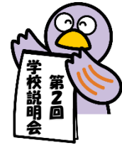
埼玉県マスコット コバトン